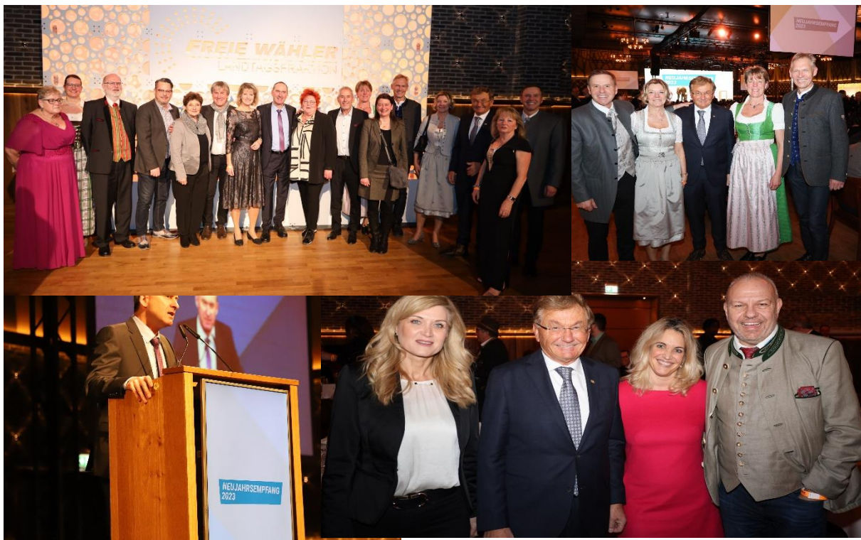
Bilder vom Neujahrsempfang 2023 der FREIEN WÄHLER Landtagsfraktion auf dem Münchner Nockherberg.