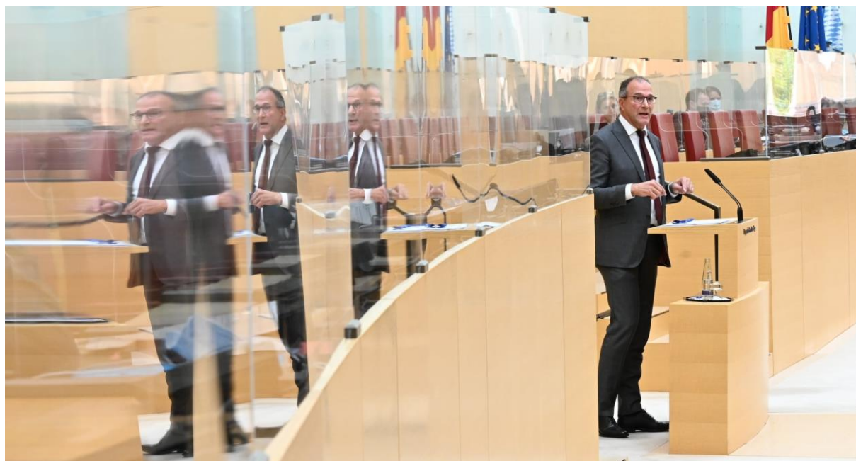
Plexiglasscheiben als neue Sicherheits- und Hygienemaßnahme im Plenum.

führen wir unsere im Sommer vorgestellten Projekte fort und machen den Freistaat fit für die Bewältigung der Corona-Krise. Dass wir damit auf dem richtigen Kurs sind, zeigt uns der neue BR-„BayernTrend“. In der Wahlumfrage haben wir um zwei Prozentpunkte auf sieben Prozent zugelegt – wenn am nächsten Sonntag Landtagswahl in Bayern wäre. Ein voller Erfolg unseres pragmatischen Weges innerhalb der Staatsregierung – den wir auch weiter zum Wohle des Freistaats gehen werden.